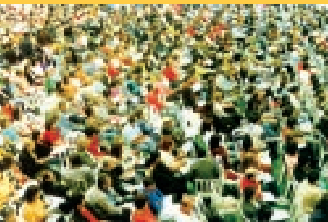
Assembléia estadual - 07/02/2004