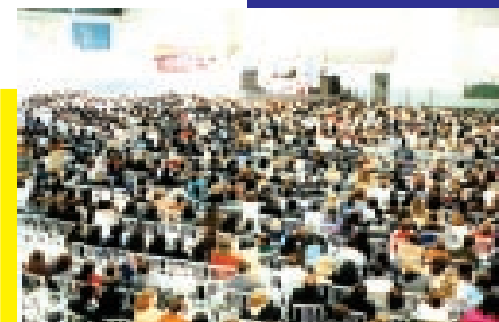
Encontro estadual de funcionários 04/06/2004

Concurso – Ainda neste ano será realizado concurso público para os funcionários. Uma bandeira histórica da categoria. A APP tem discutido com o governo os critérios para esse concurso. Já conseguimos garantir nas negociações dois pontos fundamentais: a contagem do tempo de serviço e a escolaridade de quarta série para o ingresso a auxiliar de serviços gerais, instituindo a obrigatoriedade de conclusão do ensino fundamental durante o estágio probatório. Estamos evitando assim a demissão em massa dos funcionários de escola. A APP defende que o concurso público aconteça após a aprovação do plano de carreira ainda neste ano.