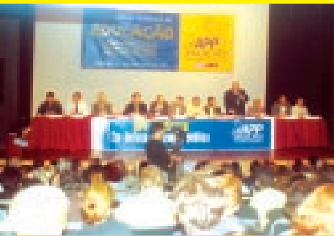
Debate com os candidatos a governador 15/08/2002