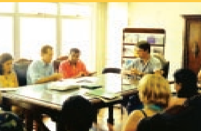
Audiência com o Secretário da Educação sobre o plano de carreira