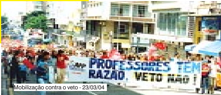
Mobilização contra o veto - 23/03/04

Orçamento de 2005: Com duas audiências públicas que realizamos no final de 2004, conseguimos que fossem aprovadas duas emendas que permitem ao governador repor nossos salários em 2005.