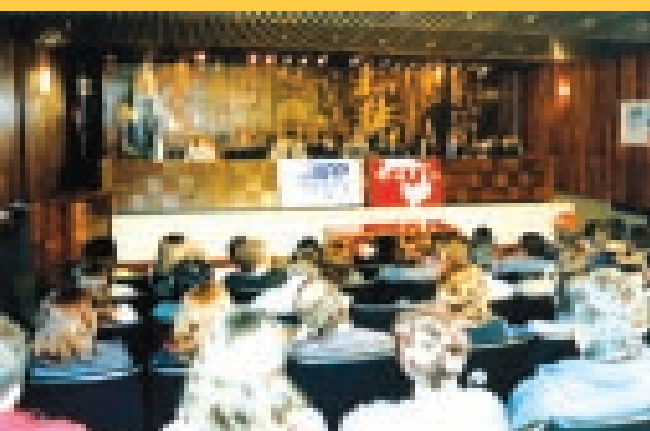
Audiência pública na A.L. - 01/08/2004